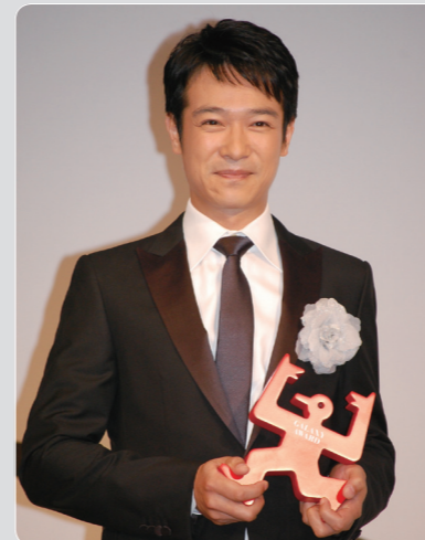
ギャラクシー個人賞を受賞した堺雅人

テレビ部門大賞はNスベ「追跡 復興予算19兆円」に! 「第50回ギャラクシー賞」贈賞式が開催