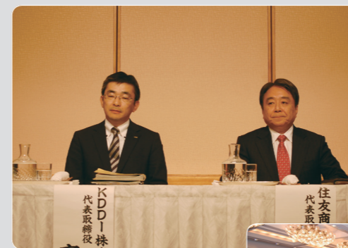
住商とKDDIによる共同会見。会場は記者で満席、注目度の高さがうかがえる

2012年10月24日、住友商事(株)とKDDI(株)による会見が急ぎ行われた。その内容は、(株)ジュビターテレコム(東京・千代田区、以下J:COM)とジャパンケーブルネット(株)(東京・中央区、以下JCN)を、2013年秋頃に統合することでの基本合意。