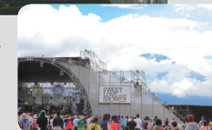
3万人が来場した今年のSLS

音楽専門チャンネル「スペースシャワーTV」((株)スペースシャワーネットワーク、東京・港区、清水英明社長)は9月1日・2日の2日間、山梨県・山中湖交流プラザ きららで、野外ライブイベント「SPACE SHOWER SWEET LOVE SHOWER 2012」(以下SLS)を開催した。17回目となる今回は、2日間で3万人を動員し、大盛況のうちに幕を閉じた。 関東圏での野外ライブ出演は実に32年振りとなる山下達郎の出演をはじめ、Dragon Ash、きゃりーぱみゅぱみゅ、EGO-WRAPPIN' AND THE GOSSIP OF JAXX、サカナクション、藤巻亮太、Perfume、難波章浩・AKIHIRO NAMBAなど、スペースシャワーTVにゆかりのある注目&話題のアーティスト39組が出演した。 山中湖での開催は今年で6回目。出演アーティストのライブパフォーマンスの素晴らしさはもちろん、スペースシャワーTVの魅力、イベントに注ぐスタッフの想いが素晴らしい雰囲気を作りだし、まさにSLSそのものが「音楽ファンに愛されるイベント」であることが体感できるものだった。SLSは山中湖の夏を告げる風物詩、そして数ある大型野外フェスの中でも独自の輝きを放つ存在になったのではないだろうか。なお、初日の模様を10月20日に、最終日を同21日の2夜連続で、スペースシャワーTVで放送される。