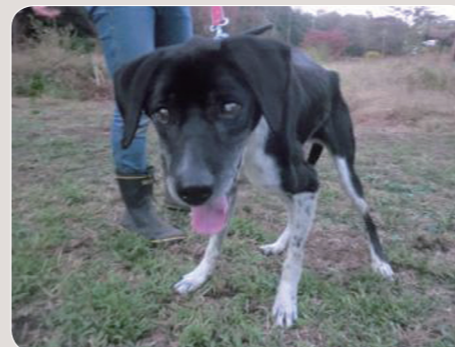
豊かな自然に囲まれて幸せそうなダブ君