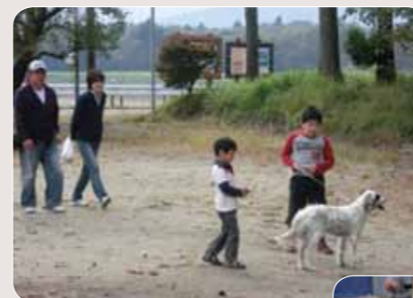
飼い主さんと久しぶりのご対面