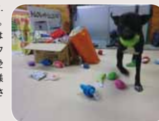
おもちゃの差し入れされて、大はしゃぎ

してくれる人たちを集めている。JDSの活動に参加したい方々は、「ドッグピオ那須高原」のブログ( http://jdogs.blog50.fc2.com/ )まで。ブログではJDSスタッフの活動、可愛い犬たちの様子も日々UPされています。